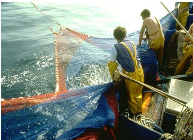
Capture de merlans bleus à la senne

Les informations disponibles sur les rejets montrent qu'ils sont très faibles. Ils ne concernent que les pêcheries destinées à la consommation humaine et, lorsque les captures de merlan bleu sont accessoires, les pêcheries ciblant d'autres espèces.