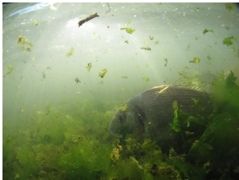
Daurade royale marquée dans l'étang du Prévost