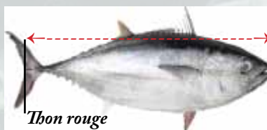
Thon rouge 115 cm ou 30 kg