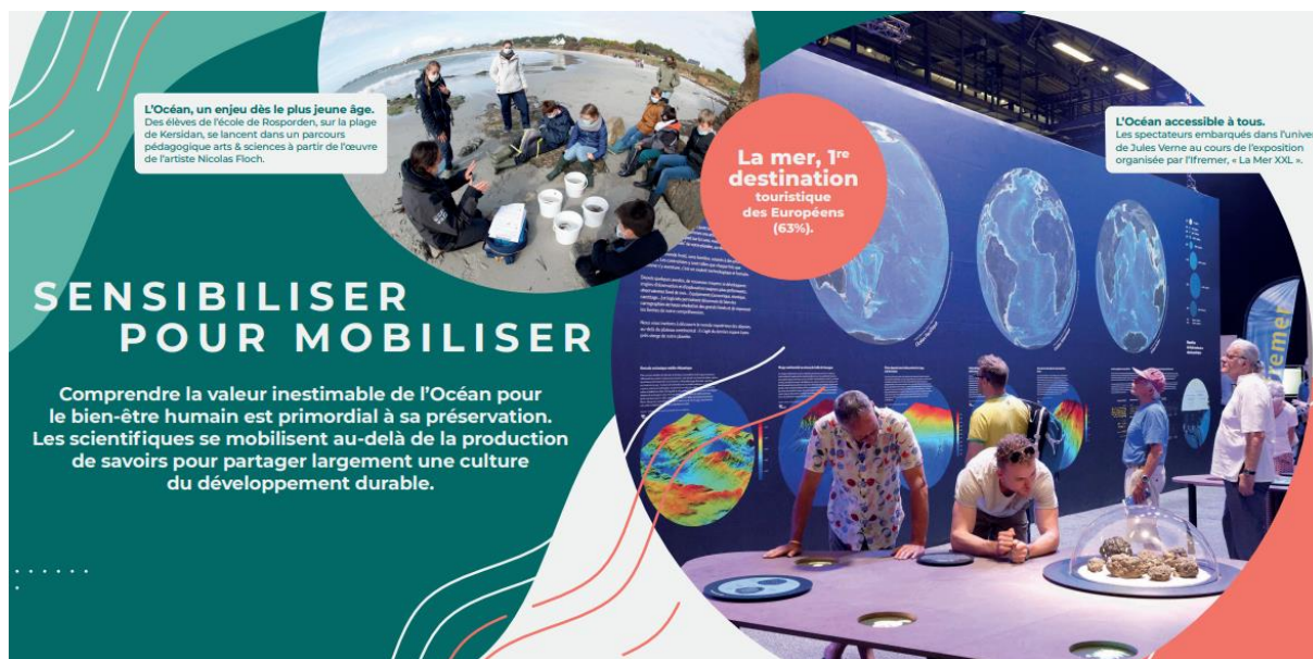
Extrait de la fresque – chapitre 5