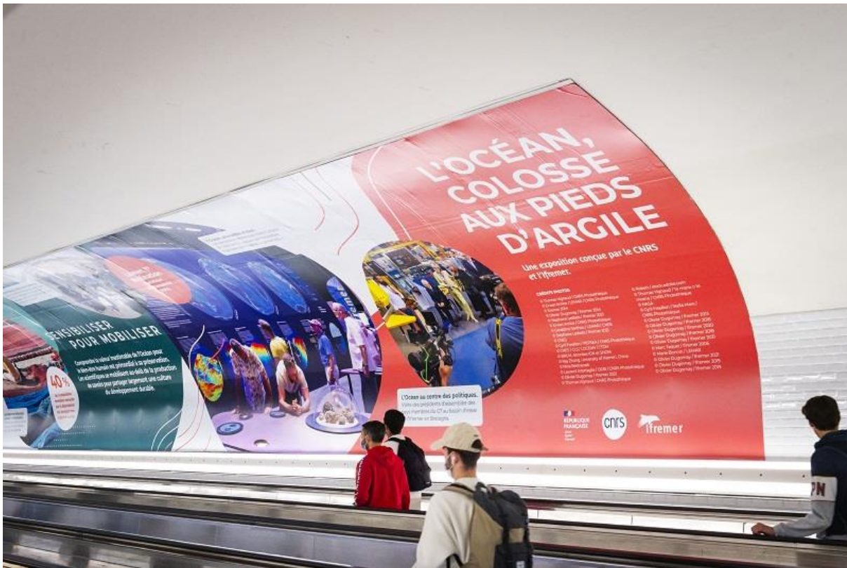
Fresque dans le couloir du metro Montparnasse-Bienvenüe