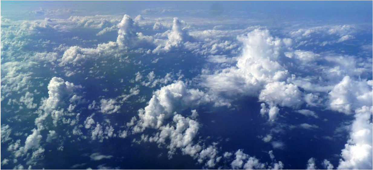
Les cumulus d'alizés, petits nuages de basse altitude, peu couvrants, forment la « majorité silencieuse » des nuages surplombant l'océan tropical. Photo prise lors de la campagne aéroportée Narval 2, en août 2016, au large de la Barbade. Elle montre une organisation en arc de cercle de ces nuages.