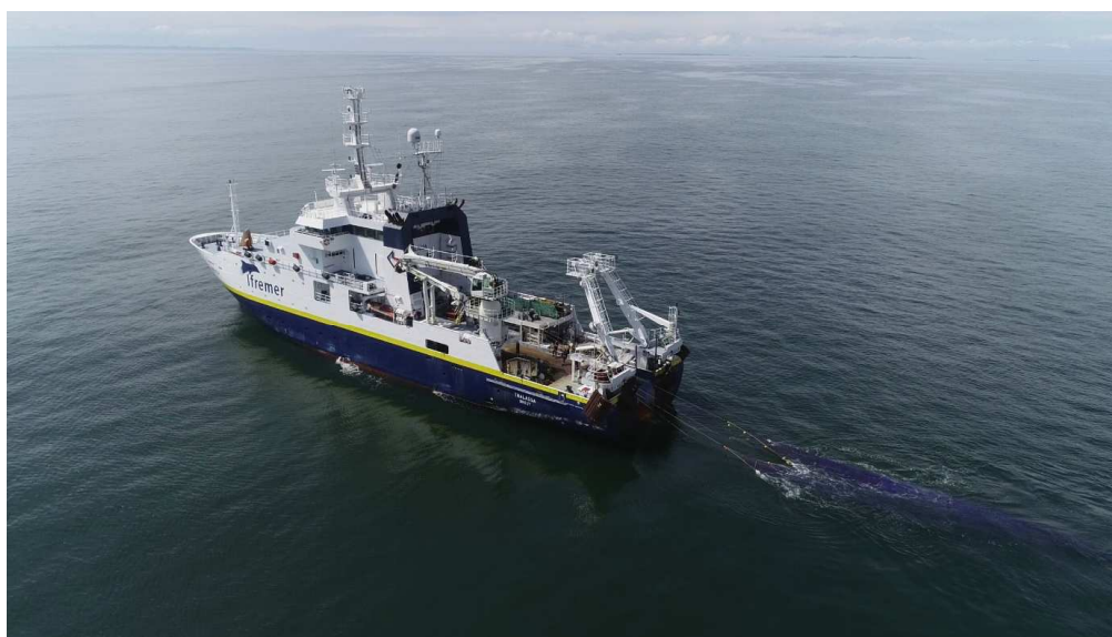
Opération de pêche menée par le Thalassa dans le golfe de Gascogne pour l'évaluation de l'abondance des petits poissons pélagiques

Thalassa , navire de la Flotte océanographique française opérée par l'Ifremer, sillonnera le golfe de Gascogne du 26 avril au 27 mai, accompagné de deux navires de pêche professionnelle, pour évaluer la biomasse des petits poissons pélagiques (ou poissons bleus) comme l'anchois et la sardine. Le navire collecte chaque année depuis près de 20 ans des données sur l'ensemble de l'écosystème pélagique, afin de comprendre comment ces poissons bleus interagissent avec leur environnement physico-chimique (température, salinité...), leurs proies planctoniques et leurs prédateurs (mammifères marins, oiseaux).