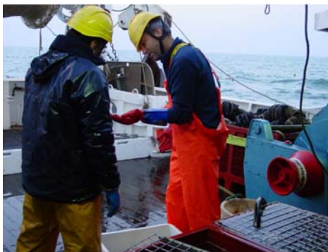
Campagne en mer dans le cadre du programme ICON

L'objectif est également de favoriser des relations scientifiques et techniques continues propices à la construction et à la valorisation de projets opérationnels, à l'expertise, au transfert de connaissances et à la diffusion des informations scientifiques et techniques.