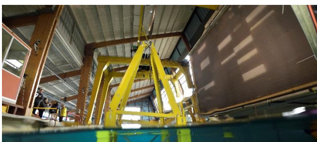
Essais d’une maquette d’éolienne flottante EOLINK au bassin d’essais du Centre Ifremer Bretagne

THEoREM est conçue autour de la mise en réseau des moyens d’essais en ingénierie marine des deux établissements, pour mener des activités de recherche et des projets collaboratifs avec des industriels français et étrangers. THEoREM regroupe les bassins de génie océanique (3 bassins à vagues de différentes capacités) et le site d’essais en mer SEM-REV de Centrale Nantes 1 , et pour l’Ifremer 2 , le bassin d’essais équipé de générateurs de houle et de vent et le site de Sainte-Anne du Portzic à Plouzané (près de Brest), ainsi que le bassin à houle et courant de Boulogne-sur-Mer, un ensemble unique en Europe.