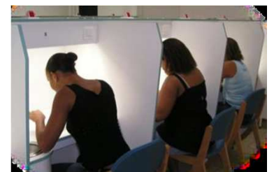
Profil sensoriel de chaque produit